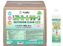
レストルームクリーン