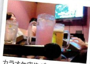
カラオケ店やパーティールーム、 集会所などに!