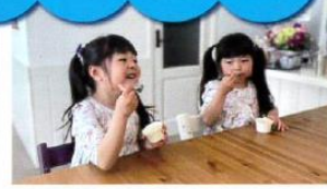
保育園、幼稚園、学童保育に!