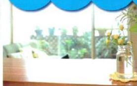
ご家庭のリビングや 書斎、寝室、子供部屋に!