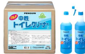
中性トイレマルチクリーナー