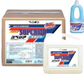
スペリア清潔空間

今、感染リスクの軽減と汚れの除去を両立させることで 建物全体の清潔レベルを維持していくことが必要です！