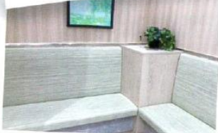
病院の待合室、診察室、調剤薬局、 介護施設や授乳室に!