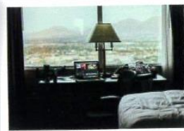
ホテル、旅館の受付や室内に!