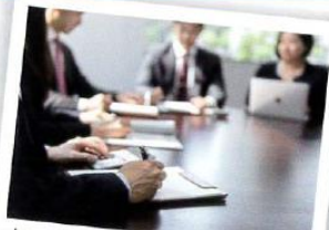
オフィス、会議室、商談スペースに!