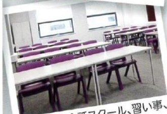
学習塾、英会話スクール、習い事、 趣味のサークルの教室に!