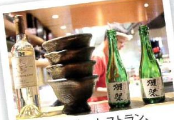
居酒屋、バー、レストラン、 カフェなど飲食店に!