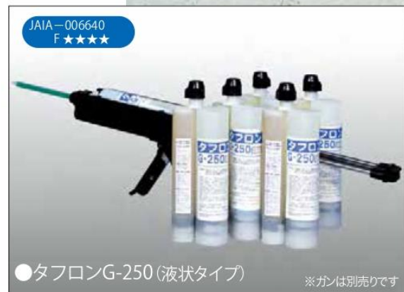
●タフロンG-250 (液状タイプ)