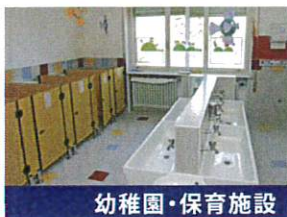
幼稚園・保育施設