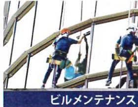
ビルメンテナンス