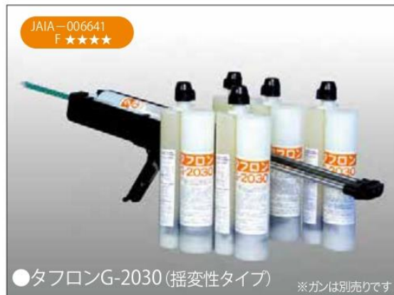
●タフロンG-2030 (揺変性タイプ)