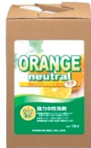
オレンジニュートラル除菌プラス